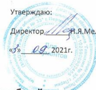
График питания на 2021-2022 учебный год.